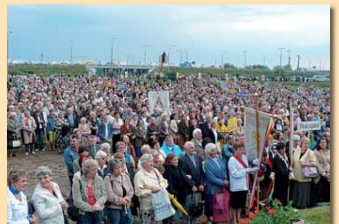
Licznie zgromadzeni wierni