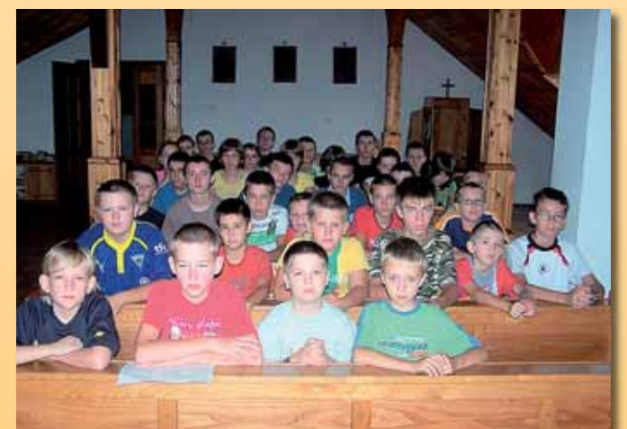
Uczestnicy „Wakacji z Bogiem” w Radomyślu nad Sanem