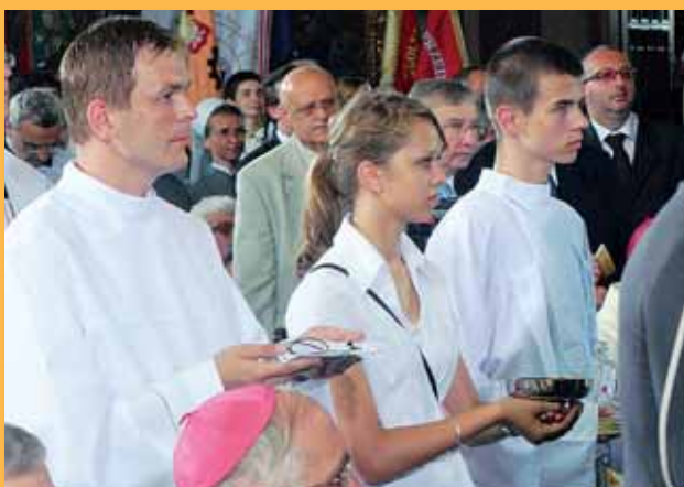
Przedstawiciele diec. LSO ofiarowali nowemu Pasterzowi srebrny krzyż Animatora LSO oraz kwiaty

13 czerwca 2009 roku papież Benedykt XVI mianował go biskupem sandomierskim. Ingres do katedry sandomierskiej i święcenia biskupie odbyły się 4 lipca 2009 roku.